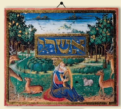
כתב דוד רוטשילד, דוד הסלך, מאה 15