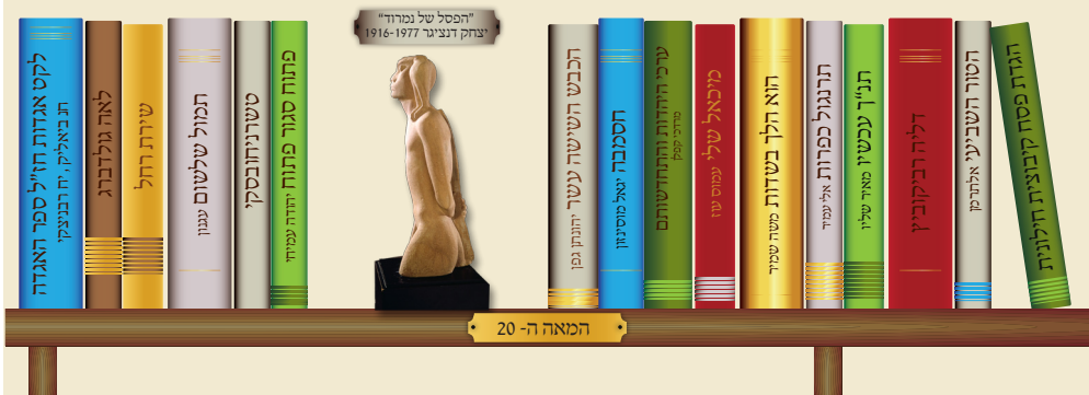
"הפסל של נמורד" יצחק דנציג 1916-1977