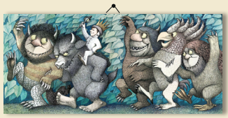
מוריס סנדק, מתוך "אריץ ציורי הפרא" מאה 20