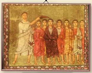
מישית חוד למלך, בית כנסת דורא ארופוס סוריה, מאה 3 לספירה