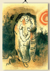
נעמי וכלתה מארק שאגאל, מאה 20