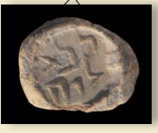
חותם לטיני, חפצים שהובאו לבית המקדש

תלמוד (בארמית גְּמָרָא) לקט אמרות, אגדות והלכות של חכמים המכונים "אמוראים" בהשראת ספר המשנה, שנערך במקביל בארץ ישראל (תלמוד ירושלמי) ובבבל (תלמוד בבלי). שני התלמודים נוצרו במאות 3-5 לספירה בכל ובישראל. שני התלמודים נכתבו בארמית. לטקסטים התלמודי שני היבטים: היבט משפטי, הבא לידי ביטוי בדיונים הלכתיים, מנומקים בהרחבה, ובהם טיעונים וטיעוני נגד, ויכוחים ומחלוקות, והיבט ספרותי ובו מדרשי אגדה רבים ותיאורים מחיי היום-יום.