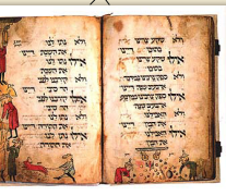
הגדת ראשי הציפורים מאה 13 לספירה, גרמניה